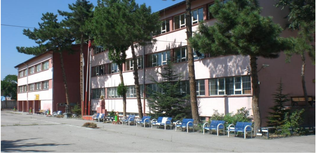
Kadı Burhaneddin Mesleki ve Teknik Anadolu Lisesi - KAYSERİ